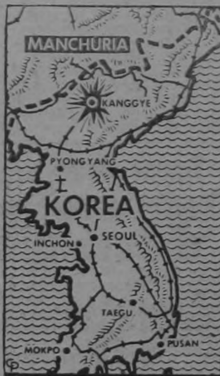
Más de un centenar de cazas de bombardeo aliados participaron en el ataque contra Kanggye, centro de abastecimiento de los comunistas a solo 50 kilómetros de la frontera manchuriana. En el bombardeo fueron destruidos 28 edificios. Los MIG de los rojos no salieron al encuentro de la flotilla aérea aliada.—(INP).